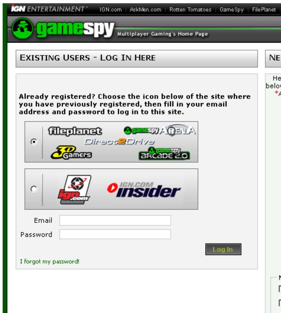
図 2-1 管理者ログイン画面

ログインが済んでいれば、ゲームのデータベーススキーマの編集が可能となります。メインのゲーム選択（Game Selection）ページからゲームを選び、ゲームテーブル（Game Tables）ページへ移動します。